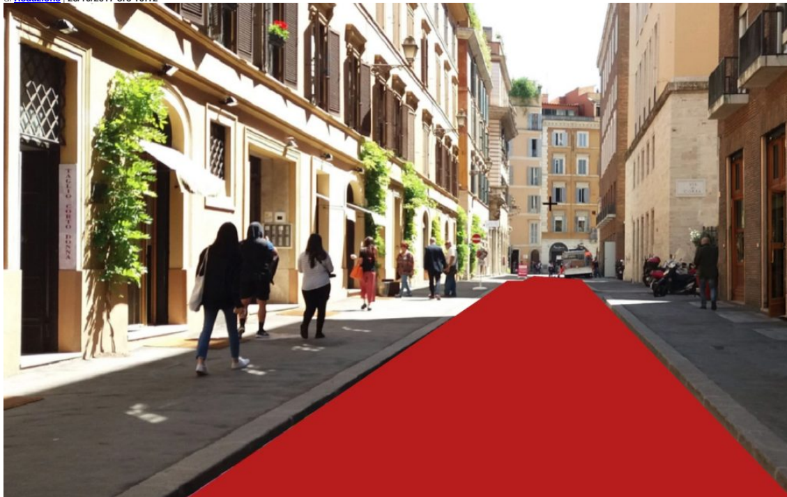
Via della Frezza, location ufficiale della 12a edizione della Festa del Cinema di Roma, è pronta ad ospitare tante Star del cinema e della Musica.

La Festa del Cinema allarga i suoi confini e arriva nel cuore della Capitale, tra Piazza di Spagna e Piazza Augusto Imperatore, dove durante i giorni della manifestazione sono previsti eventi cinematografici e altrettanti eventi musicali. Sono attese tante Star del cinema e della musica, ma anche del mondo della cultura, dell'arte e del fashion system.